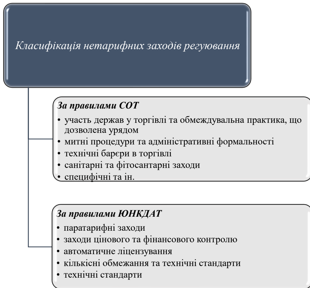
Рис 4.1. Класифікація нетарифних заходів згідно СОТ та ЮНКТАД

Нетарифне регулювання зовнішньоекономічної діяльності (рис.4.1) - це система заходів, які не базуються на встановленні митних тарифів, але спрямовані на контроль, обмеження або стимулювання зовнішньоекономічних операцій. Вони застосовуються з метою забезпечення національних інтересів, збалансованого розвитку економіки та регулювання зовнішньої торгівлі.