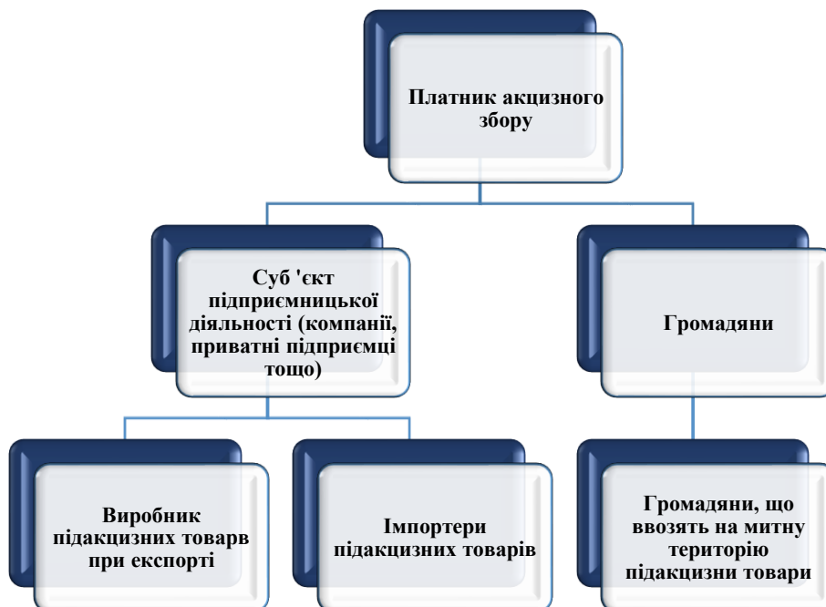
Рис. 6.1. Визначення платників акцизного збору при експорті та імпорті [6]

оформлення митних декларацій, підготовку необхідних документів, проведення митного огляду та інші процедури, пов'язані з забезпеченням відповідності товарів митним вимогам і правилам ввезення або вивезення.