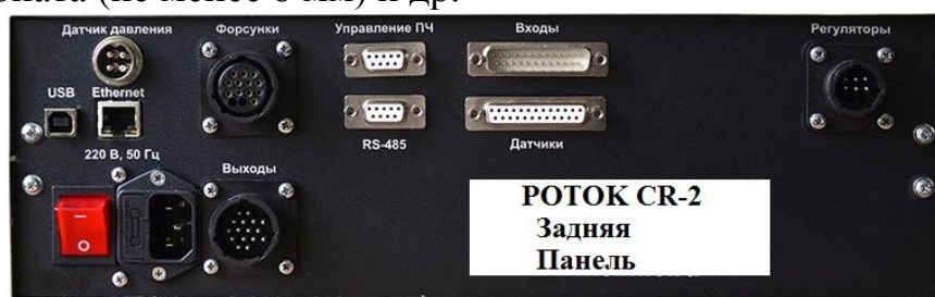
Рисунок 1 – Блок управления инжекторами Common Rail «Поток-CR2» (РБ)

Для осуществления модернизации использованы следующие компоненты: стендовый топливный насос высокого давления, дополнительная система фильтрации топлива, дополнительная система охлаждения топлива, ноутбук для управления системой, шланги, фитинги, хомуты, защитный экран из поликарбоната (не менее 8 мм) и др.