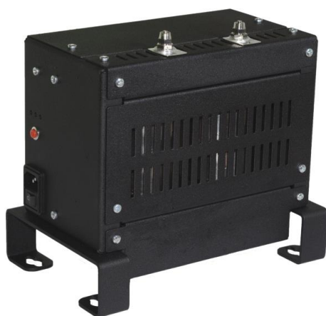
Рисунок 2 – Блок измерения производительности инжекторов Common Rail «Поток-FM2» (РБ)

Основными важными факторами в принятии решения были следующие: