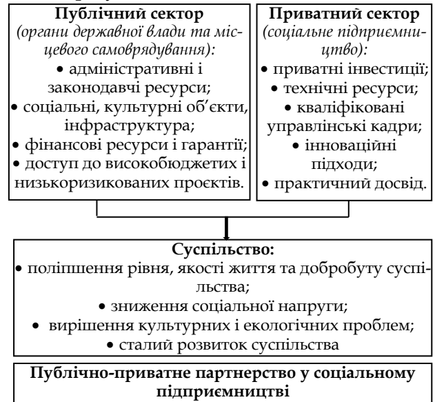
Рис. 1. Публічно-приватне партнерство у соціальному підприємстві

- підприємницький підхід, який передбачає використання у власній діяльності функції планування, аналізу, моніторингу, постійного контролю над своєю діяльністю з урахуванням економічних пріоритетів і соціальних результатів [4].