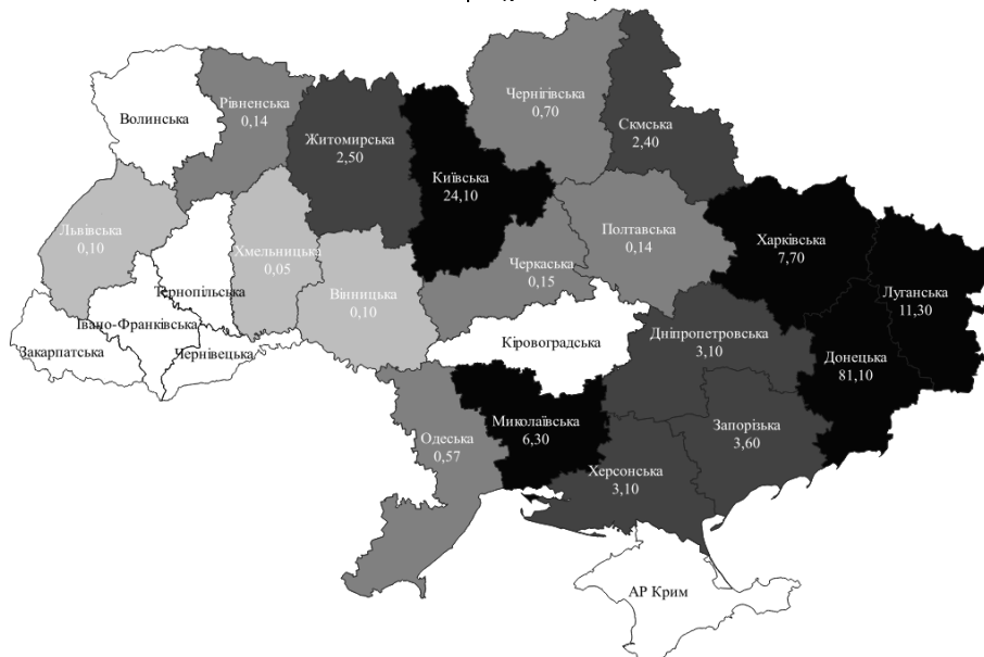
Рис. 3. Кількість пошкоджених об'єктів житлового фонду за регіонами України, тис. од. [6]

Міста Маріуполь, Харків, Чернігів, Северодонецьк і Лисичанськ зазнали найбільших пошкоджень житлового фонду. У Северодонецьку, наприклад, пошкоджено майже 90% всього житлового фонду, а кількість пошкоджених житлових будівель, включаючи багатопверхові будинки та приватні будинки, продовжує зростати через продовження активних бойових дій на територіях Харківської, Луганської, Донецької, Запорізької, Херсонської та Миколаївської областей, а також тимчасово окупованих частин території України (рис. 3).