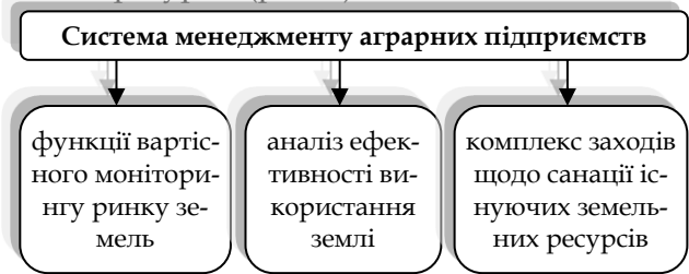
Рис. 1. Основні функції управління земельними ресурсами в системі менеджменту аграрних підприємств

комплекс заходів щодо санації існуючих земельних ресурсів (рис. 1).