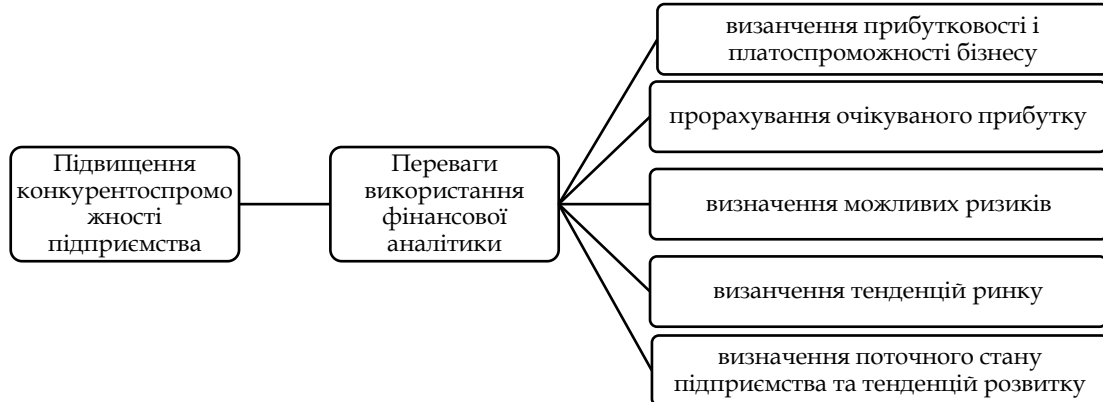
Рис. 2. Переваги використання фінансової аналітики

Сторонній людині, будь то податковий орган, інвестор чи постачальник, зазвичай важко судити про якість корпоративного менеджменту та його здатність перенести компанію в критичні часи через асиметричний характер інформації.