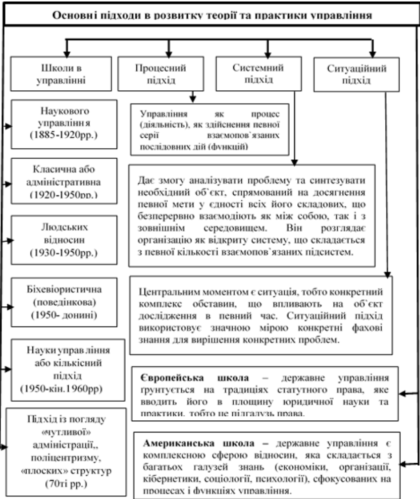
Рисунок 1 Основні теорії та школи державного управління

Завдання 3. Прокоментуйте вислів німецького філософа І. Канта: «Два людські винаходи можна вважати найбільш складними: мистецтво управляти і мистецтво виховувати»