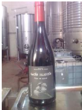
Fig. 1. Vino tinto orgánico de marca Cartán Selección

La empresa produce vino blanco y tinto. Uno de esos vinos es el excelente tinto ecológico CARTÁN SELECCIÓN.