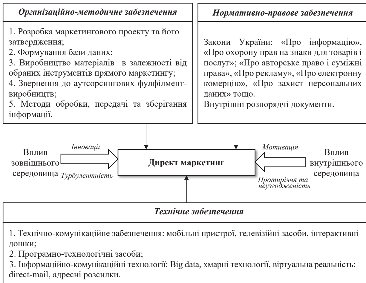
Рис. 3. Організація директ маркетингу в період цифровізації

Висновки. На фоні технічного прогресу директ маркетинг набуває все більше прихильників не тільки в сфері ритейлу, а й в інших галузях економіки, які раніше навіть не думали про необхідність застосування інструментаріїв прямих продаж. Зрозуміло, що для збільшення товарообороту, просування товарів на споживчому ринку, розширення кола клієнтів доречним використовувати всі можливі форми директ маркетингу з обов'язковим дотриманням етичних норм та правил спілкування в соціумі. Бо саме вони надають можливість зосередити інформаційний та науково-технічний потенціал на конкретному цільовому сегменті та забезпечувати тривалі,