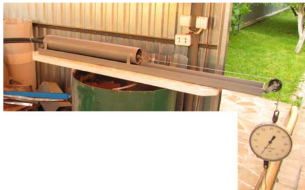
Рис. 1. Стенд для дослідження силових параметрів процесу транспортування сипких матеріалів

В центральний циліндричний отвір 5 поршня 4 перпендикулярно до осі отвору жорстко встановлено шток 11 на який надіто циліндричний диск 12 з центральним циліндричним отвором 13. Циліндричний диск 12 містить по периферії вікна 14 довільної форми (наприклад чотири), які закриті сіткою 15 для запобігання проходження сипкого матеріалу. З лівої сторони циліндричний диск 12 підтиснутий пружиною стиснення 16, яка впирається в упор 17. З іншої сторони упор 17 підтиснутий дистанційною циліндричною втулкою 18 у вигляді труби з внутрішнім діаметром більшим діаметра штока. Дистанційна втулка закріплена шпилькою 19. На кінці штока встановлено рим-болт 20, до