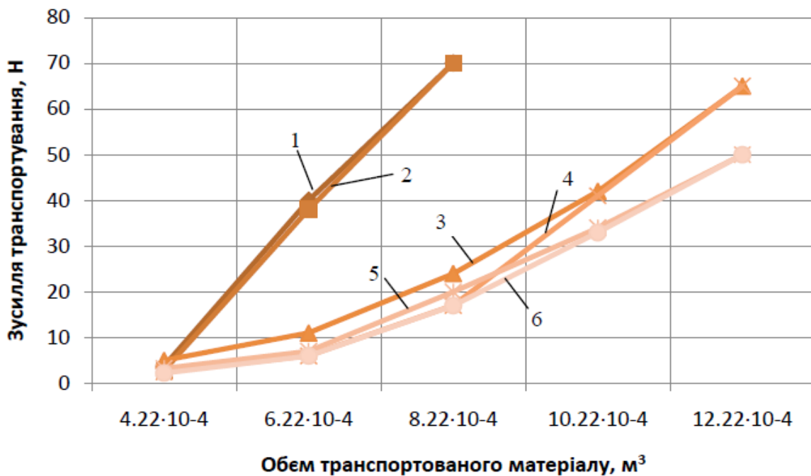
Рис. 3. Зміна зусилля переміщення сипкого матеріалу залежно від його об'єму для сипких матеріалів. 1 – пшениця без використання повітряного підживлення; 2 – пшениця з використанням повітряного підживлення; 3 – тирса без використання повітряного підживлення; 4 – тирса з використанням повітряного підживлення; 5 – висівки без використання повітряного підживлення; 6 – висівки з використанням повітряного підживлення

Висновки. 1. Зусилля транспортування сипких матеріалів зменшується практично прямо пропорційно тиску повітря в пневмосистемі.