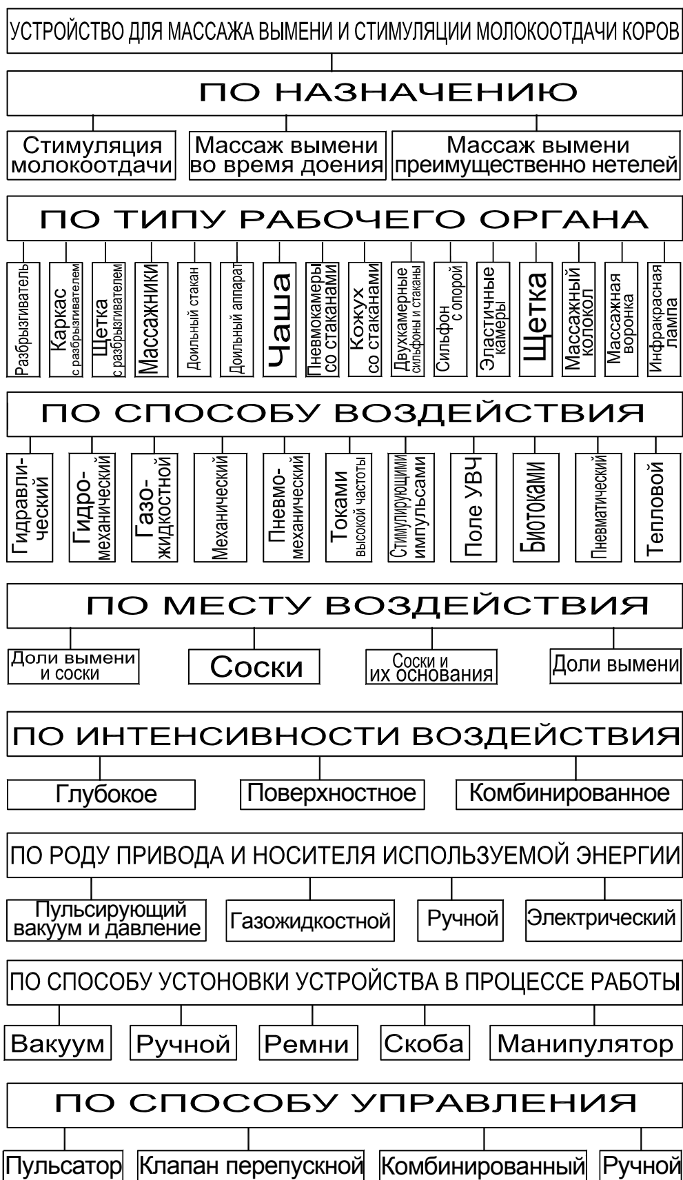
Рис. 1. Классификация устройств для массажа вымени нетелей