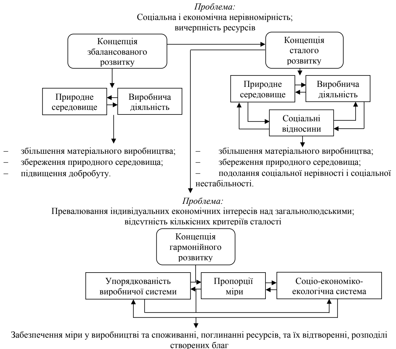
Рис. 1. Зв'язок між концепціями збалансованого, сталого і гармонійного розвитку

системного протиріччя між здатністю системи зберігати стійкість та її здатністю до трансформації; 4) визнається суттєва залежність стану економічного суб'єкта від позаекономічних чинників, що обмежує можливості математичного моделювання, проте дозволяє збільшити варіативність рішень за умови збереження гармонійних пропорцій; 5) нерівномірність і неоднаковість зміни параметрів системних елементів вважається не проблемою, а імпульсом до розвитку, тому необхідно зосереджуватися на забезпеченні важливих пропорцій; 6) особлива увага приділяється людському потенціалу, по відношенню до збільшення і використання якого накопичуються інновації і завдяки якому спостерігається формування нових знань, які виходять за межі поступальності традицій.