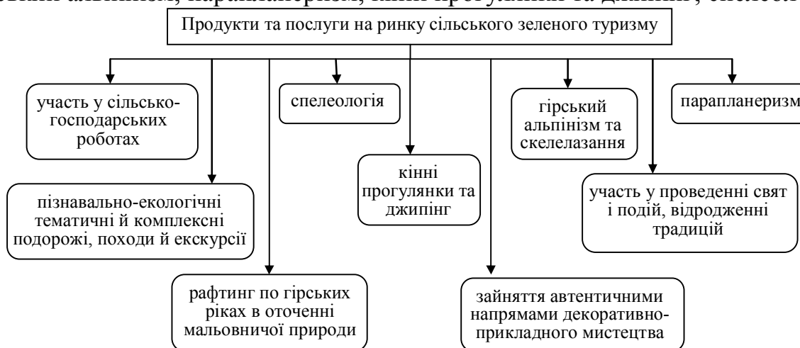
Рис. 1. Продукти та послуги на ринку сільського зеленого туризму Чернівецької області

Не використовуються належним чином унікальні за структурою та видами туристичні послуги та продукти малих підприємств (рис. 1). Крім традиційного проживання, органічного харчування й транспортування, це пізнавально-екологічні тематичні й комплексні подорожі, походи й екскурсії; участь у сільськогосподарських роботах; зайняття автентичними напрямками декоративно-прикладного мистецтва; участь у проведенні свят і подій, відродженні традицій. Унікальні пропозиції розроблені для туристичної молоді – рафтинг по гірських ріках в оточенні мальовничої природи; гірський альпінізм, парапланеризм, кінні прогулянки та джипінг; спелеологія.