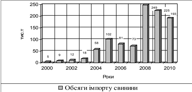
Рис. 2. Обсяги імпорту свинини в Україні протягом 2000-2010 рр., тис. т. *

* Джерело: побудовано за даними Державної служби статистики України [3].