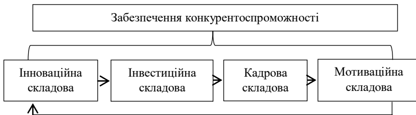
Рис. 2. Складові забезпечення конкурентоспроможності підприємства

завершальною в циклі й підґрунтям для початку нового циклу, тобто перехідною до інноваційної частини.