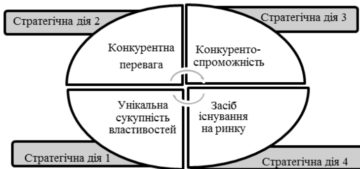
Рис. 1. Процесно-орієнтований підхід до визначення циклічності забезпечення конкурентоспроможності підприємства

3. Циклічного – забезпечення конкурентоспроможності або прагнення до лідерських позицій є безперервним процесом, який циклічно повторюється зі зміною стану об’єкта (підприємства) у часі та просторі.