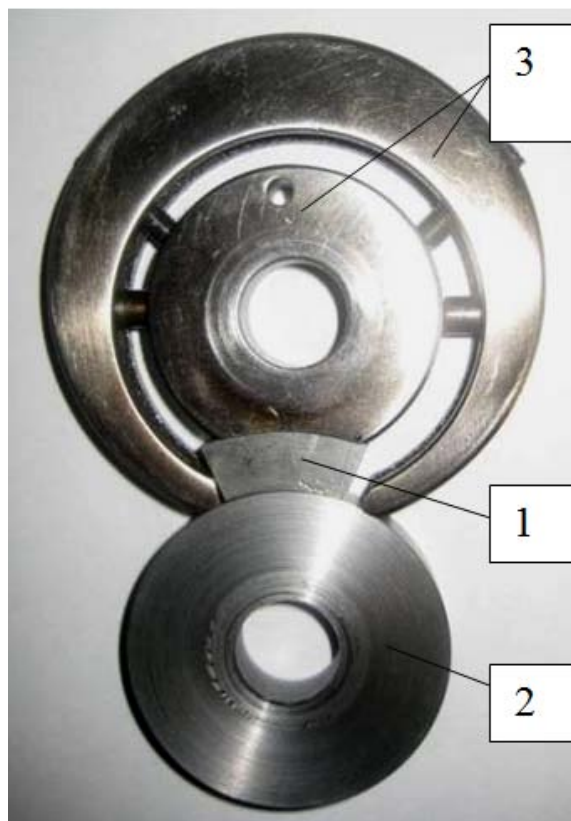
Рис. 1 - Взаємне положення зразків при випробуваннях: