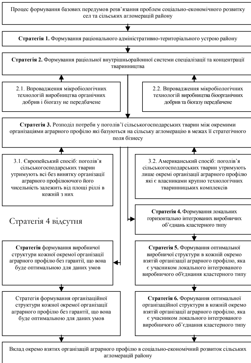
Рис. 2 Алгоритм стратегії розв'язання соціально-економічних проблем в селах і сільських агломераціях Богодухівщини