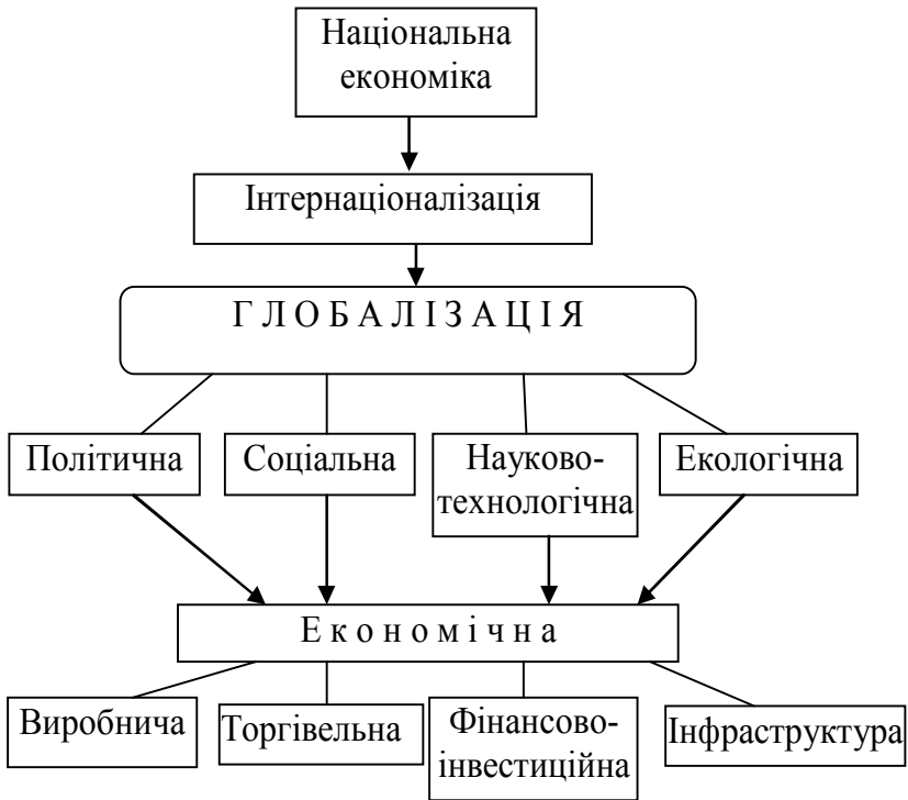
Рис. 1. Структуризація глобалізаційного процесу

Вплив інтеграції за допомогою існуючого макро - та макрорівня на глобалізацію розглянемо за допомогою рис. 2.