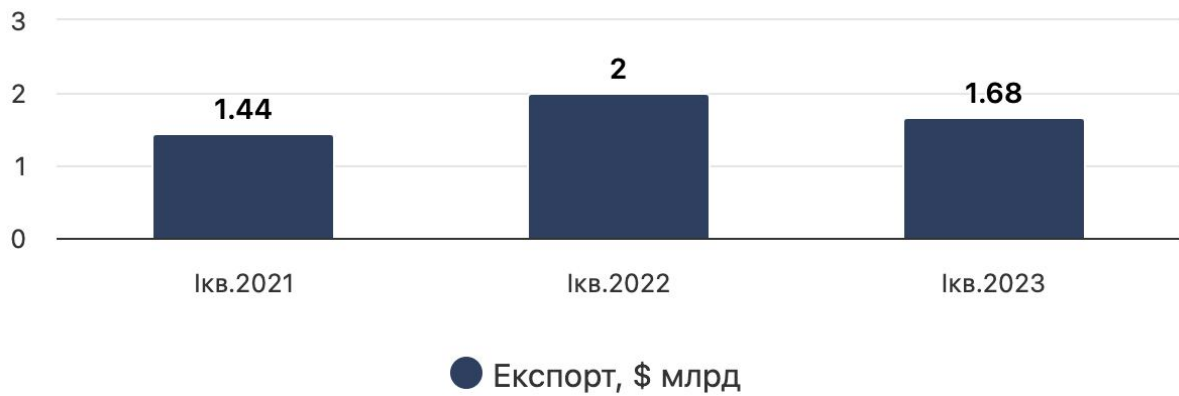
Рис. 1.8. Динаміка зміни доходу ІТ-експорту у I кварталі 2021-2023 рр. Джерело: за даними Опендатабот [36].

За перший квартал 2023 року український ІТ-сектор заробив 1,68 млрд доларів у експорті. Середній дохід за місяць склав 558 млн доларів. Частка ІТ-послуг у загальному експорті товарів та послуг сягла 12,3 % (рис. 1.8).