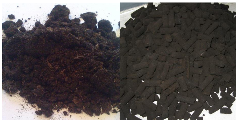
Рисунок 3 - а) исходное сырье – торф; б) гранулы.