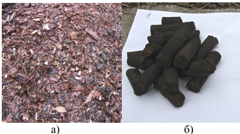
Рисунок 6 - а) исходное сырье - кора хвойных пород древесины; б) готовые гранулы

Оценка качества полученных гранул, показала следующие результаты: 1) насыпная плотность – 800-850 кг/м 3 (мнимая плотность – 1300-1350 кг/м 3 ); 2) содержание мелкой фракции - \leq 0,2\% ; 3) механическая стойкость – 99,3%. При этом, показатели качества, отражающие химический состав топливных гранул, оставались неизменным, относительно сырья. Это означает, что новый технологический подход к переработке биомассы, позволяет получать топливные гранулы с показателями качества, значительно превышающими требования стандарта ЕС, вне зависимости от типа биомассы, что подтверждает нашу гипотезу об инвариантности технологии к сырью.