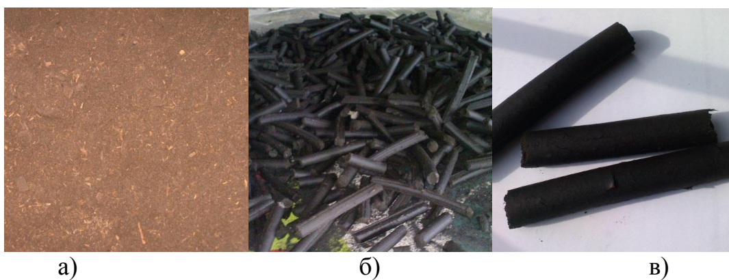
Рисунок 4 - а) исходное сырье – компост; б,в) готовая гранула.