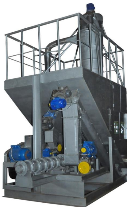
Рисунок 1 - Опытный образец технологической линии гранулирования биомассы

С помощью опытного образца технологической линии, были переработаны в топливные гранулы пробные партии таких видов биомассы как: