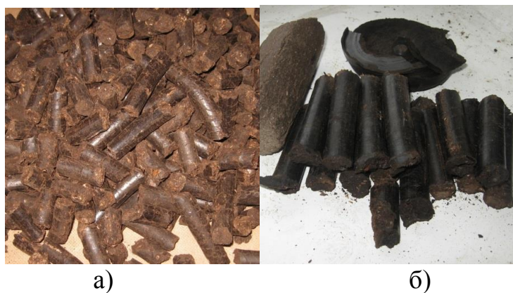
Рисунок 5 - Гранулы из растительных отходов, образующихся при уборке подсолнечника.