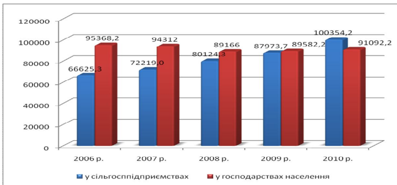
Рис. 1. Динаміка поголів'я птиці по Україні за період з 2006 по 2009 р.р.

Крім того на важливу увагу заслуговує те, що з кожним роком відбувається нарощення поголів'я саме сільськогосподарськими підприємствами, а не домогосподарствами населення (див. рис. 1).