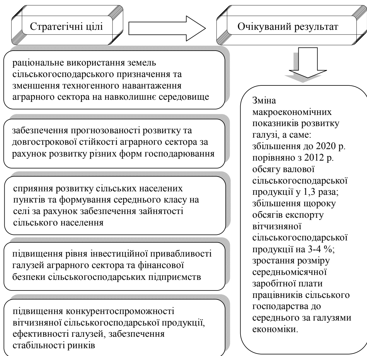
Рис. 2. Стратегічні пріоритети розвитку аграрного сектора економіки

для забезпечення соціальних стандартів проживаючому населенню. Сюди входить централізоване водо-, газопостачання, вулиці з твердим покриттям, транспортне пасажирське сполучення з районними та обласними центрами, дошкільні заклади й школи, амбулаторія лікаря загальної практики, заклади культури, торгове і житлово-комунальне обслуговування.