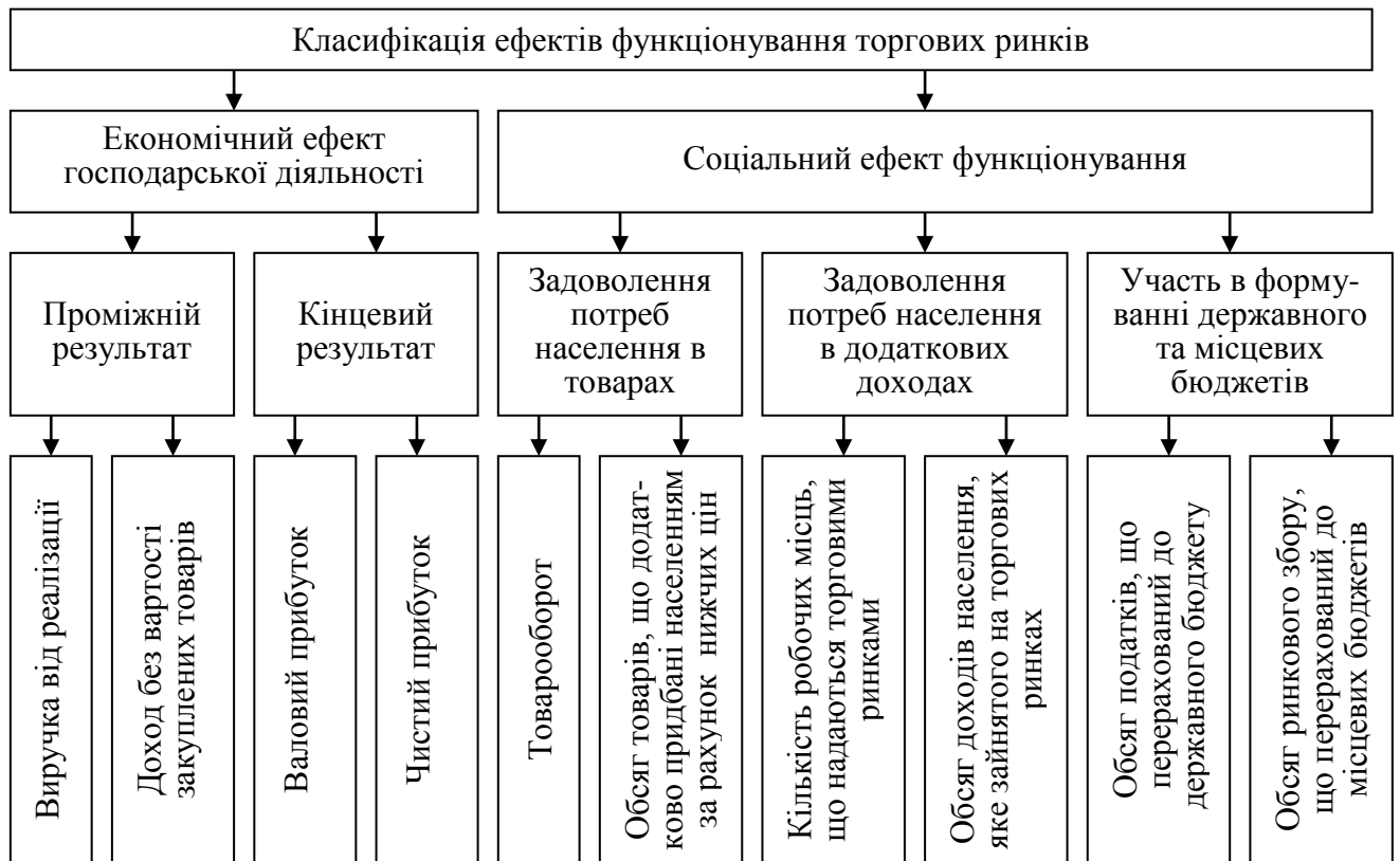
Рис. 1 Класифікація ефектів функціонування торгових ринків

вої соціально-економічної ефективності торгових ринків; проведено дослідження соціальної ефективності торгових ринків та тенденцій її розвитку на основі запропонованої системи показників; проведено комплексну оцінку господарської діяльності торгових ринків і визначено стан і тенденції її економічної ефективності; розглянуто фінансовий стан торгових ринків та досліджено стан і тенденції розвитку показників ефективності фінансової діяльності.