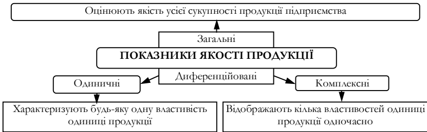
Рис. 1. Система і зміст показників якості продукції [2, с.347]

У цих випадках для оцінки рівня якості застосовують одиничні і комплексні показники якості, одночасно використовуючи і комплексний, і диференціальний методи, тобто оцінку роблять змішаним методом [3, с.56].