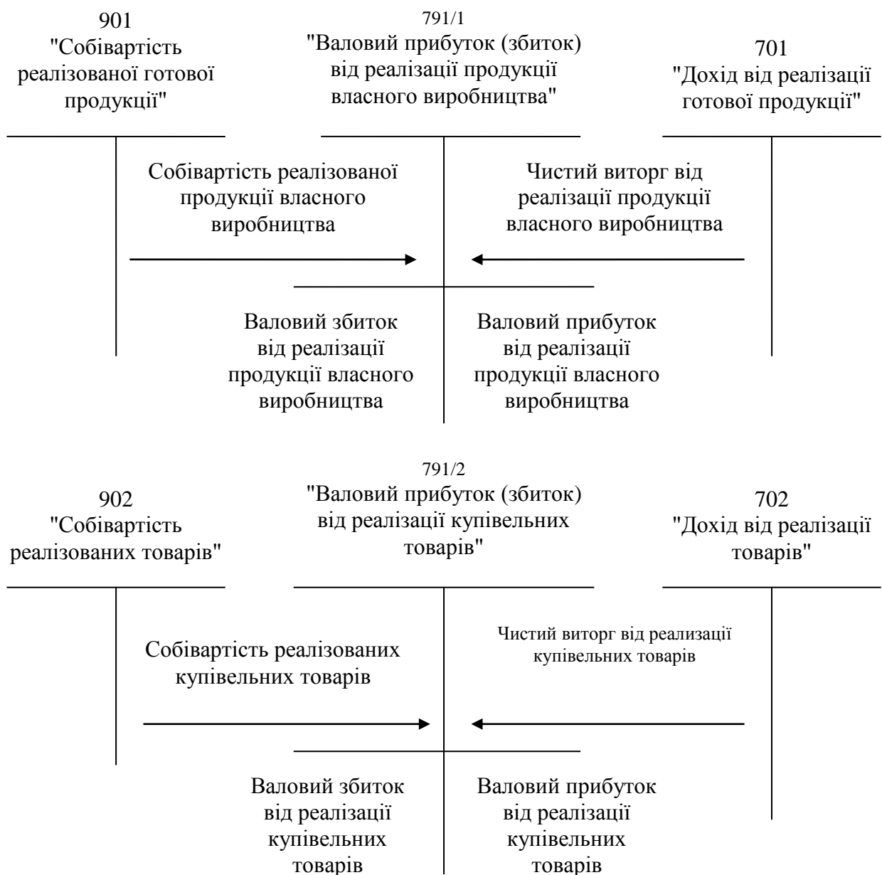
Рис. 2 – Рекомендована схема бухгалтерських записів з формування валового прибутку (збитку) від реалізації за складовими частинами товарообігу підприємств харчування

Розроблено методику обліку фінансових результатів, яка надає можливість визначення валового прибутку (збитку) від реалізації за складовими частинами товарообігу підприємств харчування і сприяє росту аналітичних можливостей бухгалтерського обліку та ефективності використання облікової інформації в процесі управління (рис. 2).