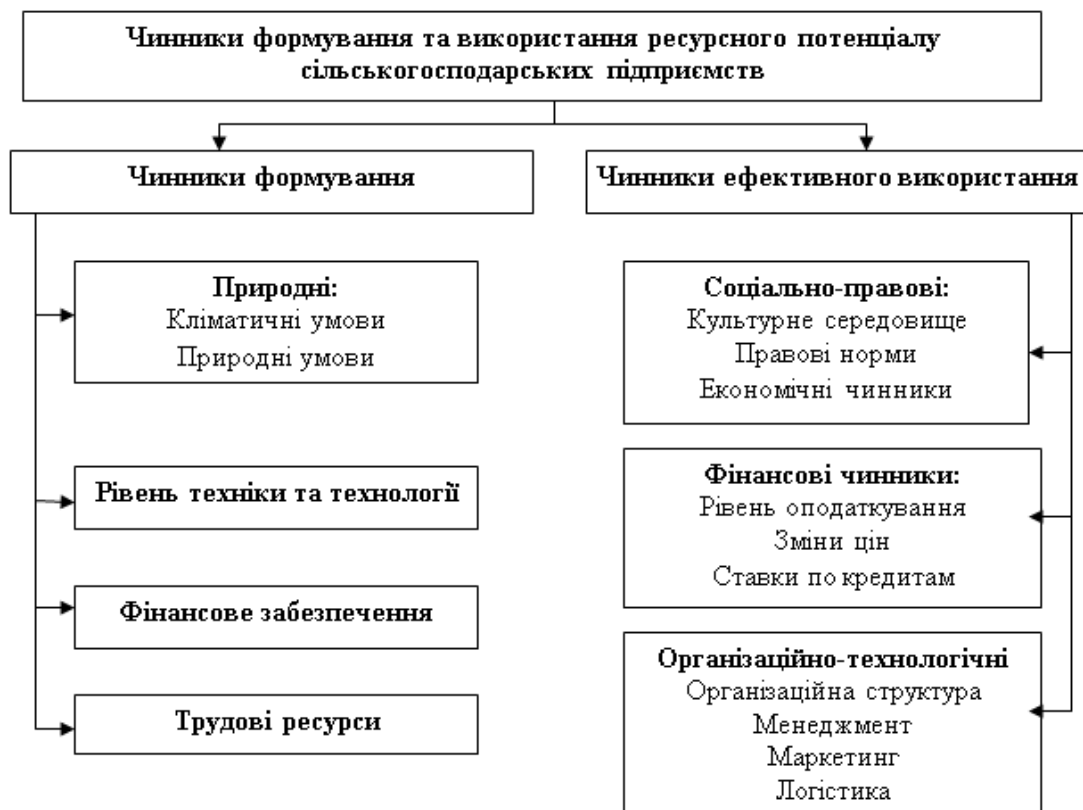
Рис. 2. Чинники формування та використання ресурсного потенціалу сільськогосподарського підприємства

Ефективність використання ресурсного потенціалу підприємствами сфери сільського господарства зумовлюється впливом ряду чинників, які можна поділити на дві групи: чинники формування ресурсного потенціалу та чинники його ефективного використання (рис. 2).