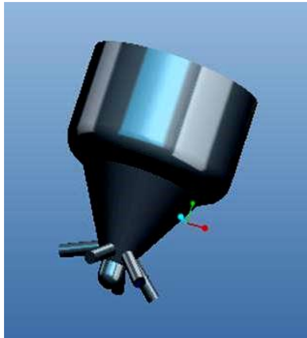
Рисунок – 2 Прийнята геометрія елемента проточна частина розпилювача АЗПІ з одним розпилюючим отвором (а) і розбивка на елементи (сітка) прийнятої геометрії проточної частини (б)

При розрахункових дослідженнях проведено моделювання стаціонарного течії нафтового ДП і емульсії 70% РО і 30% ЕС в проточній частині розпилювача при максимальному підйомі голки форсунки h_{i \max} = 0,32 мм (Проливання розпилювача, але при підвищеному тиску). Тиск на вході в розрахункову область прийнято рівним p_{\text{палив вх}} = 51,5 МПа, що відповідає тиску в процесі подачі палива серійної паливної системи дизеля Д-245.12С (4ЧН11/12,5) [4]. Температура палива прийнята постійною і рівною t = 40^{\circ}\text{C} . Для обмеження часу розрахунку розглянута симетрична геометрія елемента проточної частини розпилювача з одним розпилюючим отвором, представлена на рис. 2.