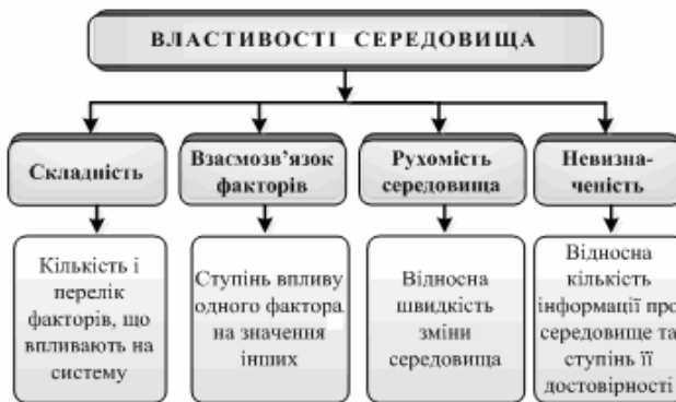
Рис. 3. Модель властивостей зовнішнього середовища

– модель властивостей зовнішнього середовища – як такі можуть бути розглянуті складність середовища, його рухомість, ступінь визначеності, взаємозв'язок факторів середовища (рисунок 3) [7].