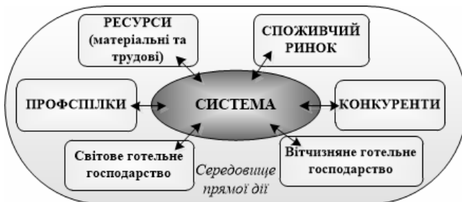
Рис. 1. Модель зовнішнього середовища прямої дії для засобу розміщення

– модель середовища прямої дії – навколишні системи, з якими безпосередньо взаємодіє засіб розміщення як система (рисунок 1);