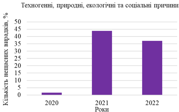
Рисунок 1 – Динаміка зростання кількості нещасних випадків

Суттєве зростання кількості нещасних випадків з техногенних причин пов'язано з пандемією коронавірусної інфекції SARS-CoV-2. Це зумовлено випадками інфікування медичних та інших працівників на COVID-19, роботи яких пов'язані з виконанням професійних обов'язків в умовах підвищеного ризику зараження та, які розслідуються як випадки гострого професійного захворювання.