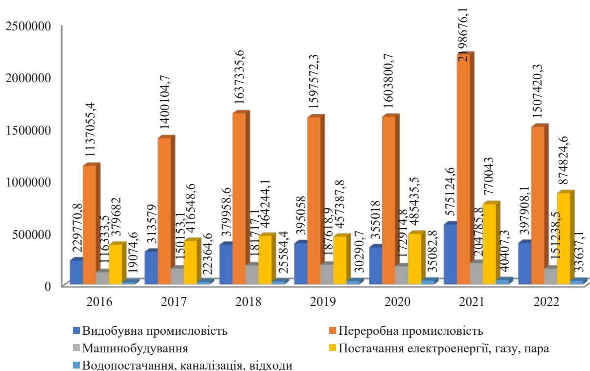
Рис. 1. Обсяг реалізованої промислової продукції за видами діяльності за 2016–2022 рр, млн грн

Поширення у 2020–2023 роках наявних некерованих факторів (російська військова агресія; коронавірусна інфекція) та пов'язаних з ними обмеженнями економічної діяльності призвели до загального економічного спаду. Так, обсяги реалізованої продукції за всіма видами економічної діяльності демонстрували стабільну тенденцію зростання до 2021 р. Під час пандемії COVID-19 та карантинних заходів, рівень розвитку промислового ринку у 2021 р. порівняно з 2016 р. виріс майже у два рази. Це пояснюється тим, що запроваджені урядом обмежувальні заходи майже не торкнулись діяльності промислових підприємств, однак, зменшення рівня загального попиту та світових цін на сировину та матеріали на фоні карантинних заходів, а також невирішені логістичні