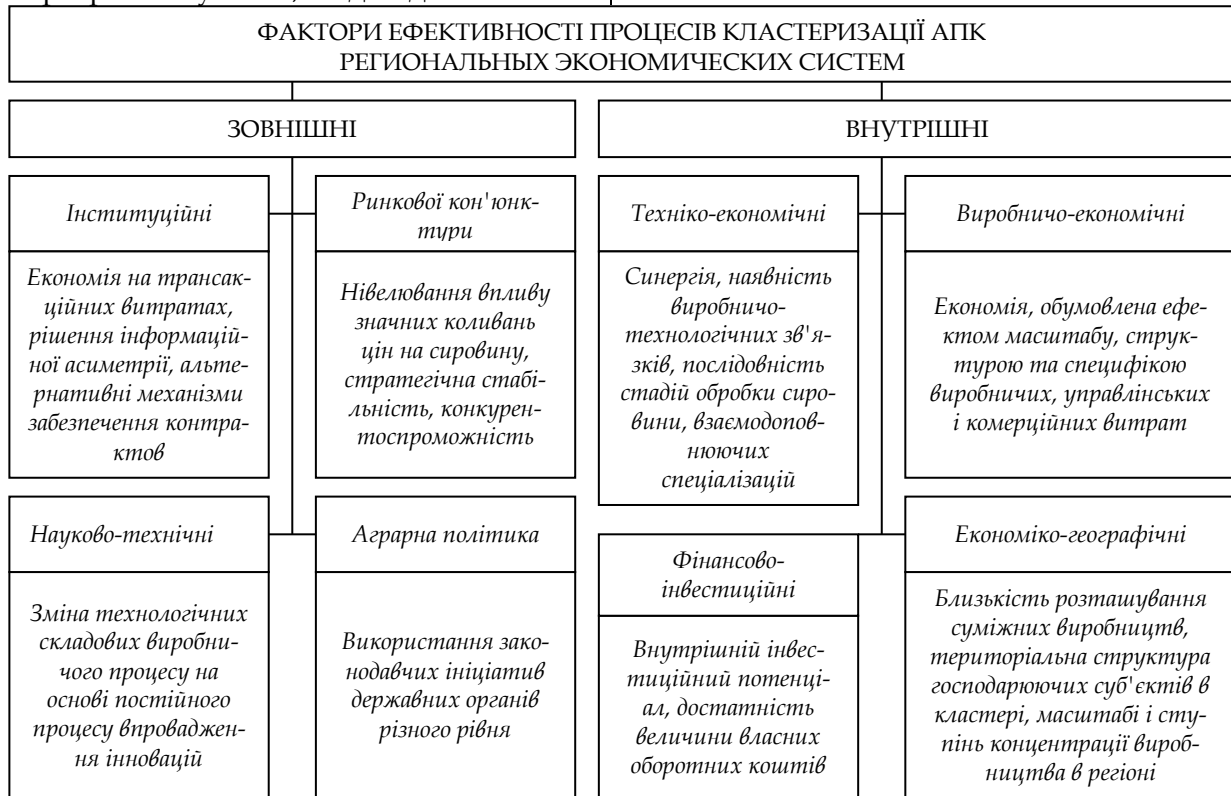
Рис. 1. Фактори ефективності процесів кластеризації АПК

ливості кластерів, властиві складним економічним системам: поліцентричності, тобто наявність ряду організацій-лідерів, що реалізують ідею збалансованого управління розвитком суб'єктів кластера; сонаправлений розвиток - єдиний вектор розвитку суб'єктів кластера; адекватне прояв синергетичного ефекту на основі підвищення ступеня інтегрованості згідно закону емерджентності.