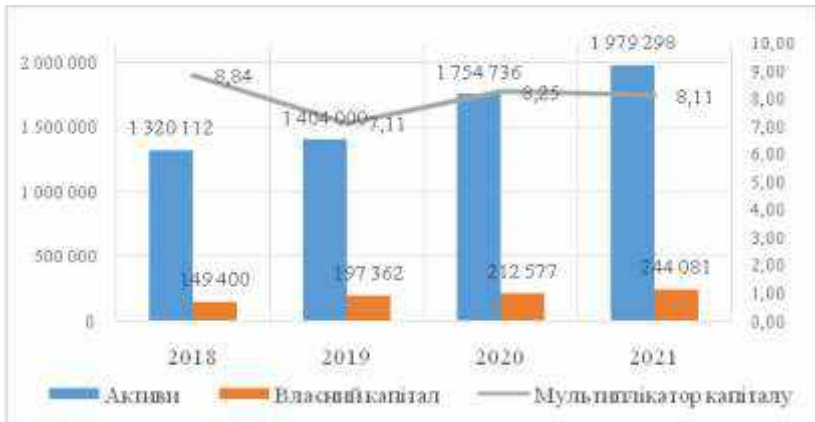
Рис. 1. Мультиплікатор капіталу банків України 2018-2021рр., рази

Мультиплікатор капіталу - це показник, який характеризує рівень покриття активів за рахунок капіталу і обчислюється як відношення суми загальних активів до власного капіталу банку. Так як власний капітал має покривати збитки за активами, більший рівень мультиплікатора свідчить про більші ризики банкрутства банку. Проте, з іншої сторони, вищий рівень мультиплікатора вказує на вищий потенціал банку. Оптимальне значення мультиплікатора капіталу має коливатися від 0 до 12 [3].