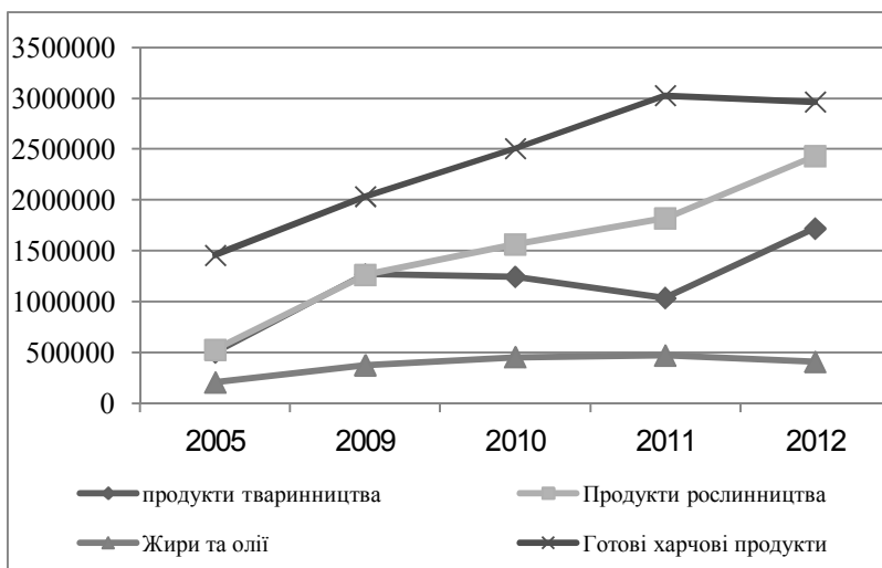
Рис. 2. Насиченість національного ринку, продуктами споживання, що імпортуються іншими країнами в період з 2005 по 2012 роки (тис. дол.)

Спрямовані дії з боку держави, щодо підвищення конкурентоспроможності вітчизняної продукції, будуть сприяти витісненню імпорту з продовольчих ринків країни та позитивно вплинуть на розвиток аграрного виробництва та сільських територій. Більш того підтримка з боку держави сприятиме підвищенню життєвого рівня населення країни та насиченню внутрішнього ринку. Головною метою з боку держави, на думку автора, необхідно формувати систему державної підтримки національного виробника шляхом демонополізації та розвитком конкурентних відносин серед агропромислових підприємств.