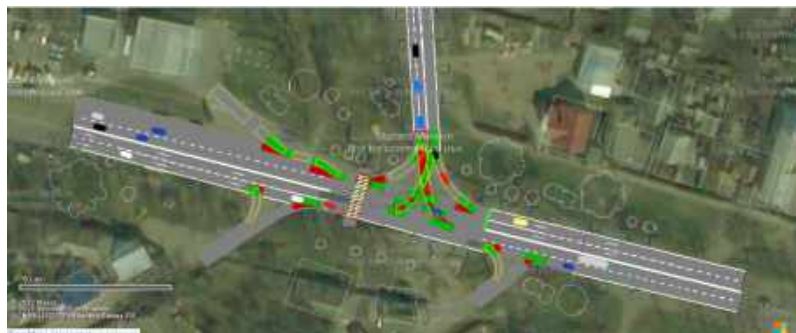
Рисунок 2- Модель об'єкта в PTV Vissim

Для перевірки розроблених заходів, пропонуємо застосування засобів імітаційного моделювання для виявлення ризику виникнення конфліктних ситуацій. У якості засобів імітаційного моделювання буде застосовано програмне забезпечення PTV Vissim.