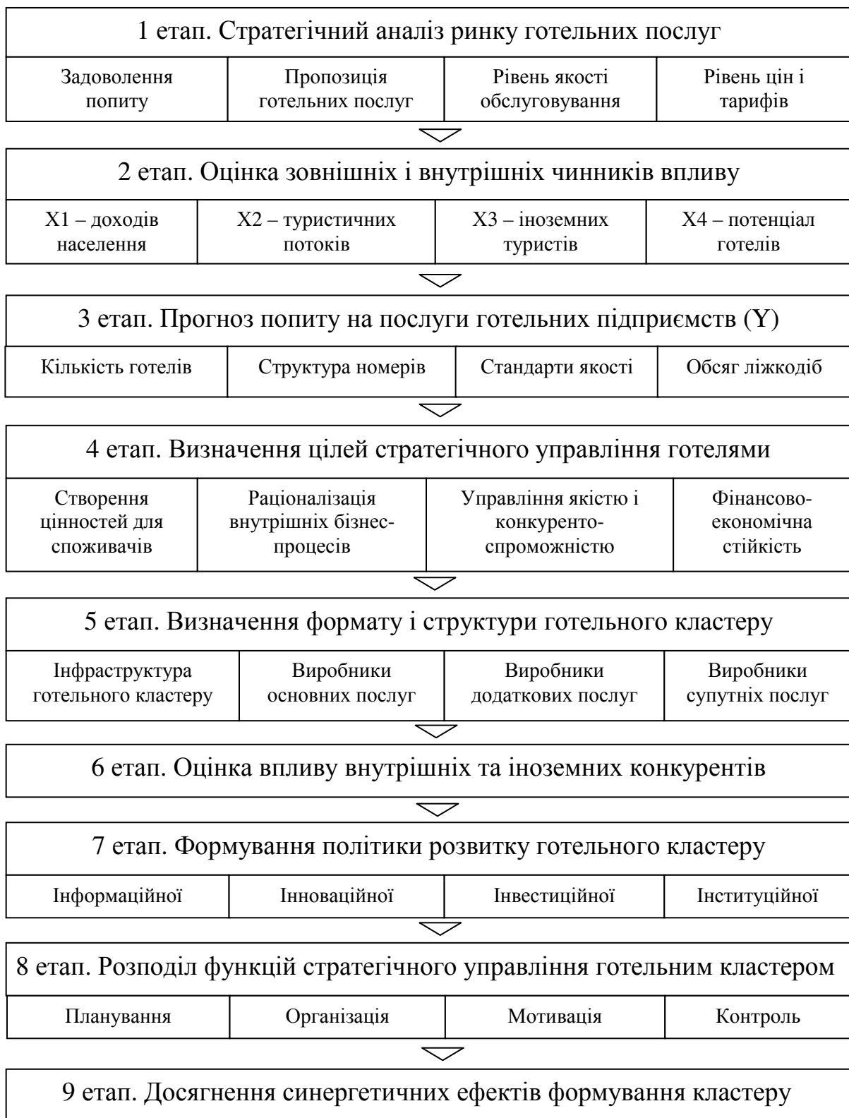
Рис. 3. Модель стратегічного управління формуванням та розвитком кластером підприємств готельного господарства

З метою інтеграції готельних підприємств розроблено структурно-логічну схему організаційного процесу зі створення й розвитку готельного кластера, в якій визначено такі блоки: підготовчий; розробка концепції управління кластером; розробка норм і правил взаємодії в кластері; управління