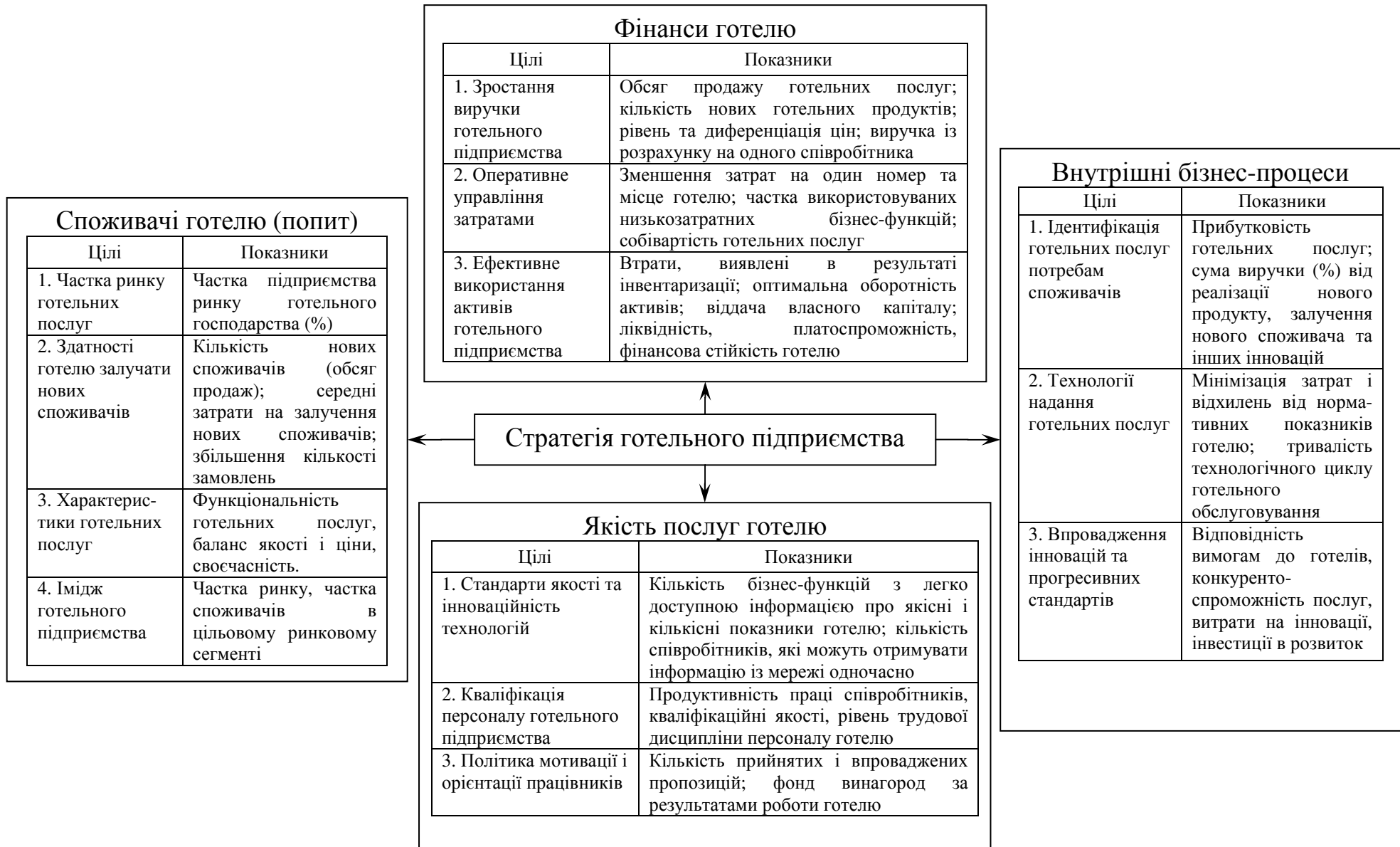
Рис. 1. Стратегічна карта та система збалансованих показників підприємства готельного господарства