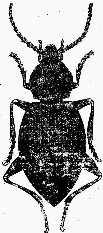
Рис. 1. Общий вид Vembidion prokorenkoi sp.n.