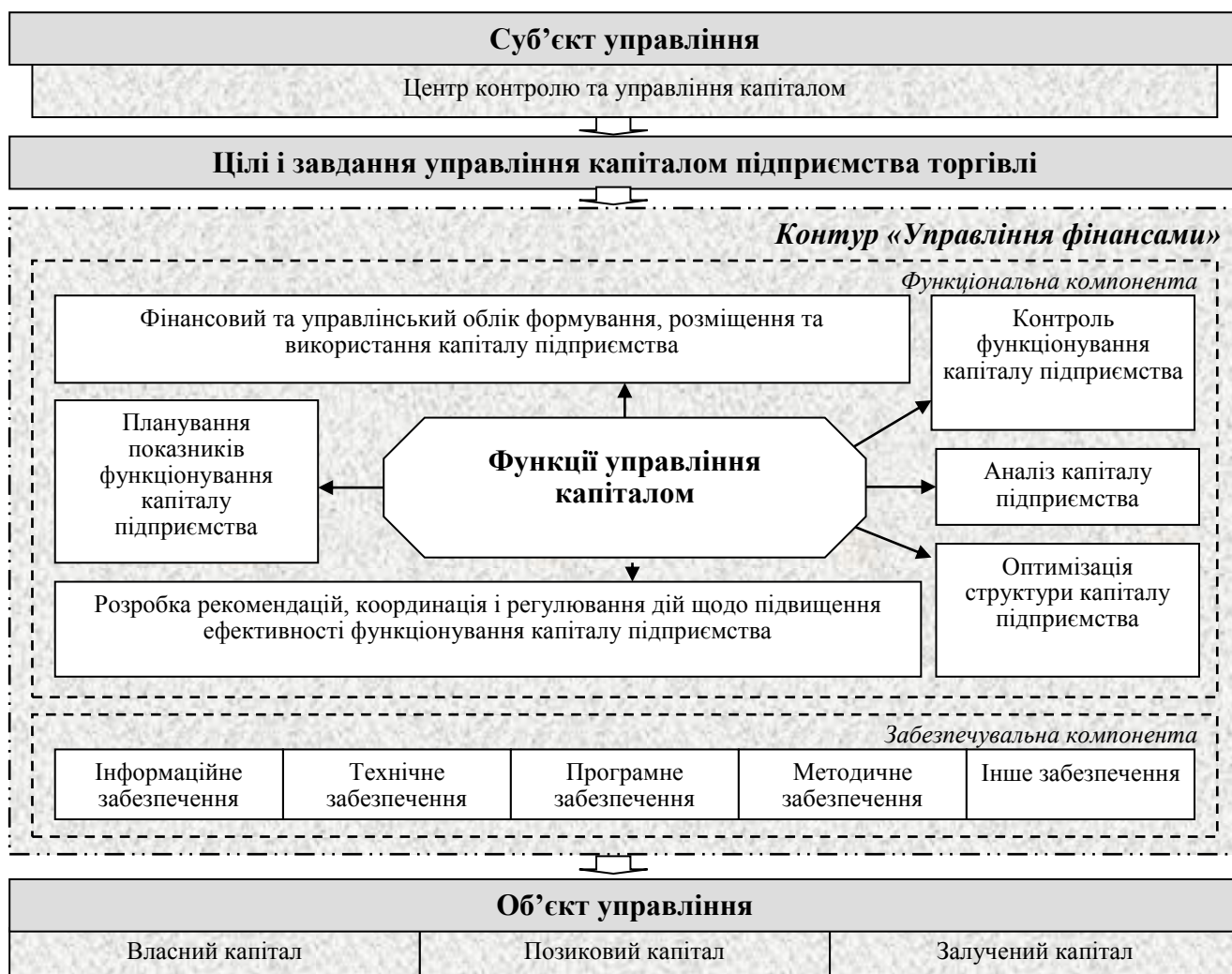
Рис. 2. Функціональна модель управління капіталом підприємства торгівлі на базі контуру управління фінансами

Для забезпечення якісно нового рівня формування інформаційного масиву облікових даних розроблено організаційну модель обліку капіталу та руху інформаційних потоків в інтегрованій інформаційно-аналітичній системі управління підприємством торгівлі, перевагами якої є виявлення місць локалізації інформації, шляхів її пересування, трансформації у вихідні формати звітів для вирішення оперативних питань у реальному масштабі часу і забезпечення підвищення якості інформаційних зв'язків менеджерів відповідних рівнів та вищого керівництва.