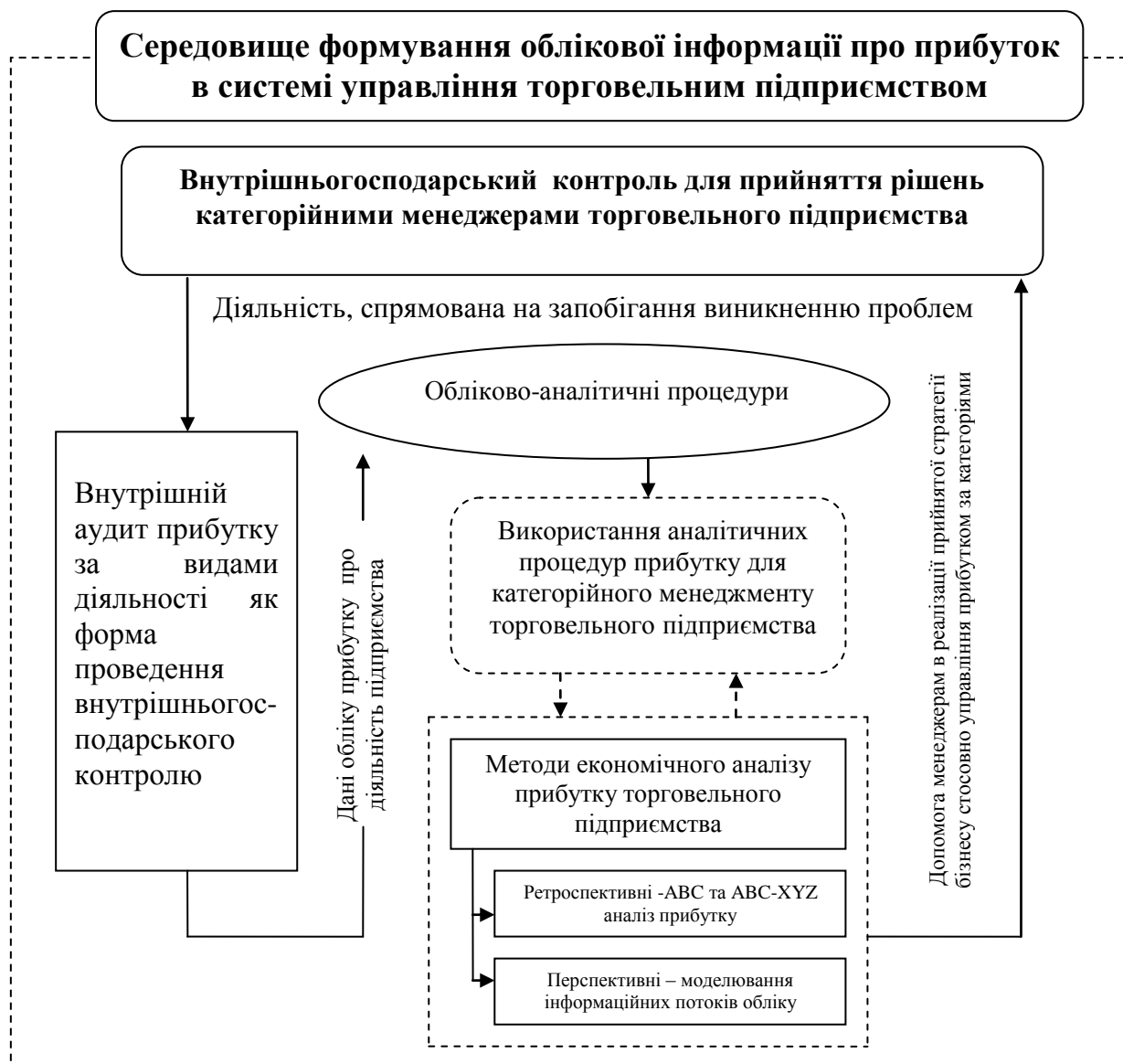
Рис. 3. Формування облікової інформації про прибуток для прийняття управлінських рішень

З метою інформаційного забезпечення діяльності підприємств запропоновано комплексний підхід до формування обліку прибутку у поєднанні внутрішнього аудиту та аналізу, який сприятиме підвищенню достовірності інформації в системі прийняття управлінських рішень (рис. 3).