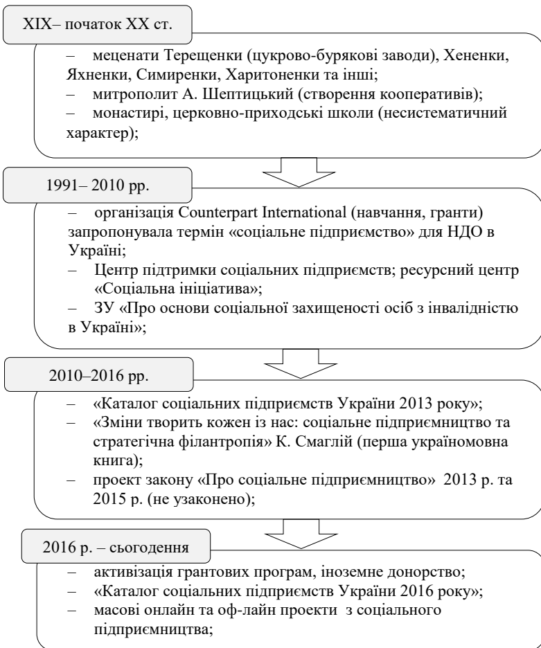
Рисунок 1 – Етапи розвитку соціального підприємництва в Україні