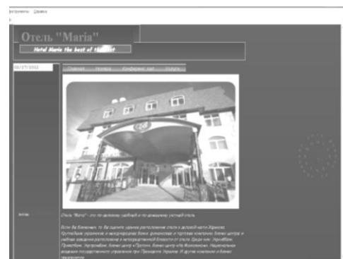
Рисунок – Головна сторінка сайту готелю «Марія»

Дизайнерським рішенням було обрати фон, розмістити основні посилання: «онлайн бронювання» і «спеціальні пропозиції». Для швидкого ознайомлення з усіма можливостями готелю, основні розділи винесені в «слайдер» (рис.). У результаті проектування був створений сайт, який може залучати нових відвідувачів у готель і є основним джерелом реклами.