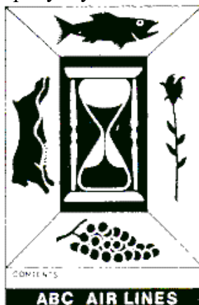
Рис. 1. Знак «Perishable» (Швидкопсувний вантаж), синього кольору

Знак «Perishable» (Швидкопсувний вантаж), синього кольору зображений на рисунку 1. Знак розміщення вантажного місця (стрілки) – для вантажів, що оброблюються як «мокрий вантаж» зображений на рисунку 2.