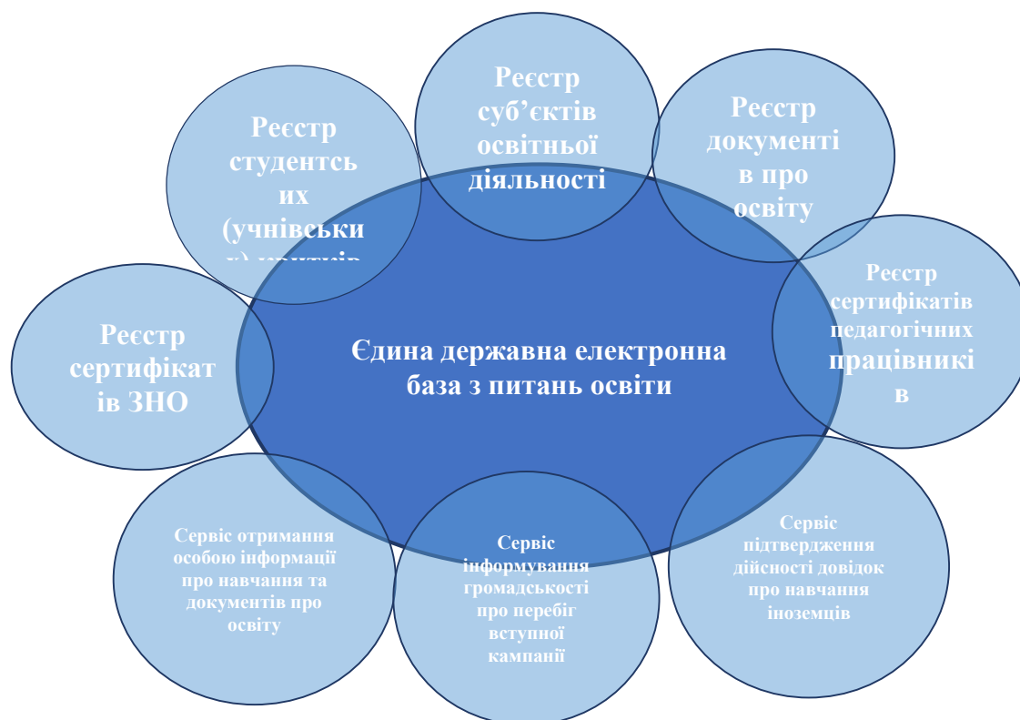
Рис. 2 – Реєстри та сервіси Єдиної державної електронної бази з питань освіти

У нових реаліях опинилися заклади професійної (професійно-технічної) (ЗП(ПТ)О), фахової передвищої (ЗФПО) та вищої освіти (ЗВО), студенти й викладачі яких масово вступали до лав Збройних сил України (ЗСУ) та територіальної оборони. Деякі викладачі продовжували навчати студентів навіть із лінії фронту. Заклади освіти стали штабами допомоги населенню й військовим. Учасники освітнього процесу та науковці працювали як волонтери, збирали й передавали кошти ЗСУ, записували відеозвернення до міжнародних ЗМІ, у яких розповідали про реалії російської агресії [2].