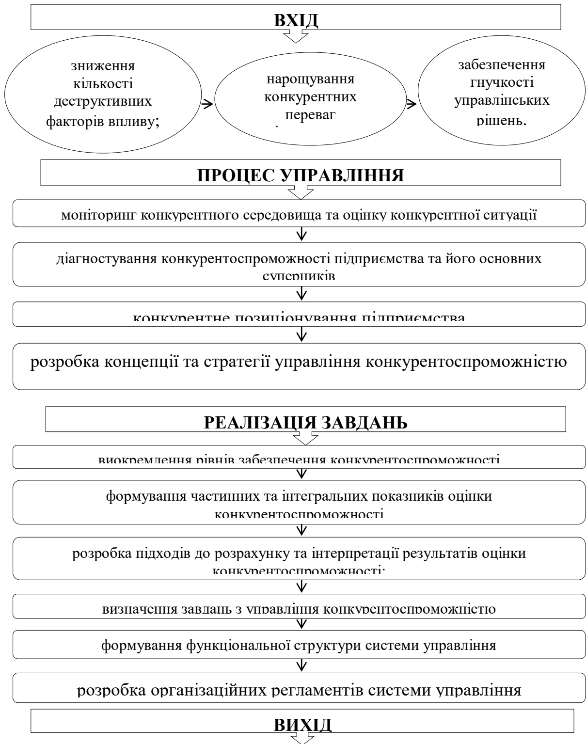
Рис. 2. Система управління конкурентоспроможністю підприємницької діяльності