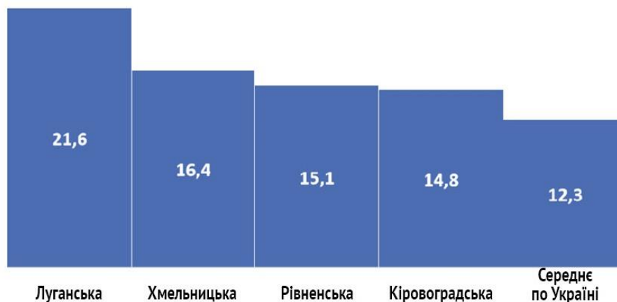
- Рисунок 3 – Області України з найбільшою врожайністю за 2019 р.

Серед областей-лідерів з виробництва гречки слід відмітити Луганську, Хмельницька, Рівненська, Кіровоградська (рис.3). Частка у виробництві зерна для гречки у вказаних областях становить 8,1-22,8 %.