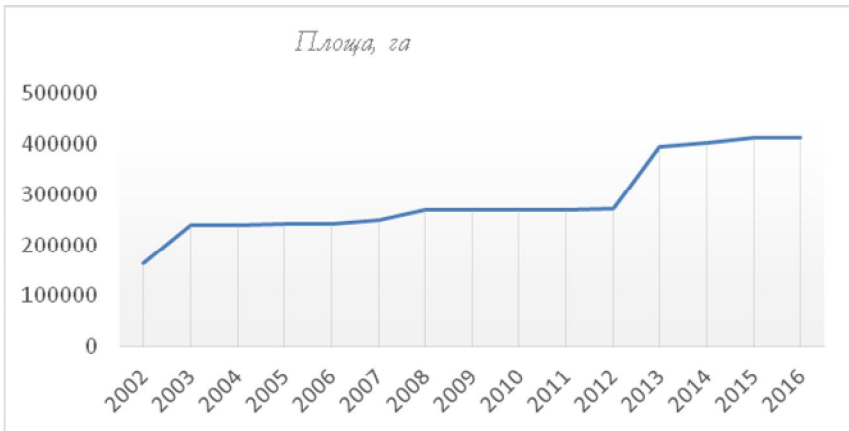
Рис. 1. Загальна площа органічних с.-г. угідь в Україні 2002-2016 р.

Офіційні статистичні огляди IFOAM підтверджують, що якщо в 2002 р. в Україні було зареєстровано 31 господарство, що отримало статус «органічного», то в 2016 р. нараховувалось вже 360 сертифікованих органічних господарства, а загальна площа сільськогосподарських угідь, на яких ведеться органічне виробництво, склала 411 200 га [4].