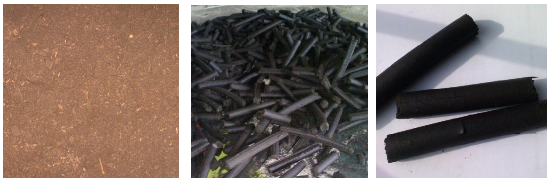
Рисунок 4. а) исходное сырье – компост; б, в) готовая гранула.