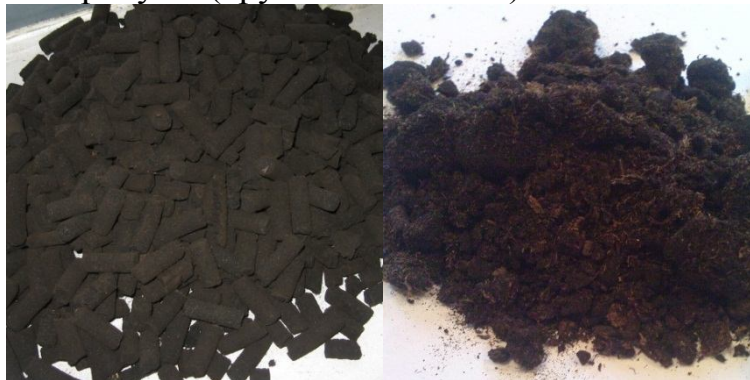
Рисунок 3. а) исходное сырье – торф; б) гранулы.