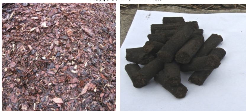
Рисунок 6. а) исходное сырье - кора хвойных пород древесины; б) готовые гранулы

Оценка качества полученных гранул, показала следующие результаты: 1) насыпная плотность – 800-850 кг/м 3 (мнимая плотность – 1300-1350 кг/м 3 ); 2) содержание мелкой фракции - \leq 0,2\% ; 3) механическая стойкость – 99,3%. При этом, показатели качества, отражающие химический состав топливных гранул, оставались неизменным, относительно сырья. Это означает, что новый технологический подход к переработке биомассы, позволяет получать топливные гранулы с показателями качества, значительно превышающими требования стандарта ЕС, вне зависимости от типа биомассы, что подтверждает нашу гипотезу об инвариантности технологии к сырью.