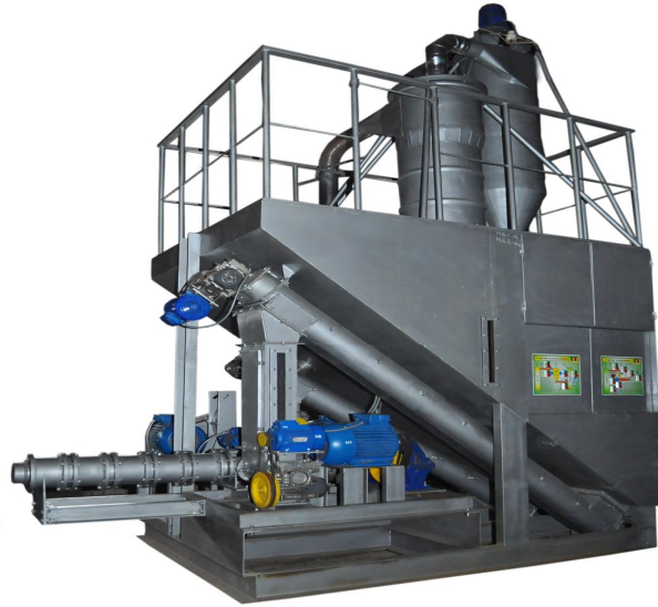
Рисунок 1. Опытный образец технологической линии гранулирования биомассы

С помощью опытного образца технологической линии, были переработаны в топливные гранулы пробные партии таких видов биомассы как: