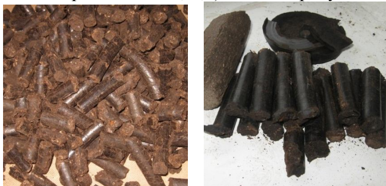
Рисунок 5. Гранулы из растительных отходов, образующихся при уборке подсолнечника.