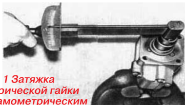
Рис. 1 Затяжка сферической гайки динамометрическим ключом.

Колебания (виляние) передних направляющих колес, наиболее характерно выраженные при движении на повышенных скоростях, чаще всего указывает на ослабление затяжки упорных подшипников золотникового механизма гидроусилителя или на их значительный износ.