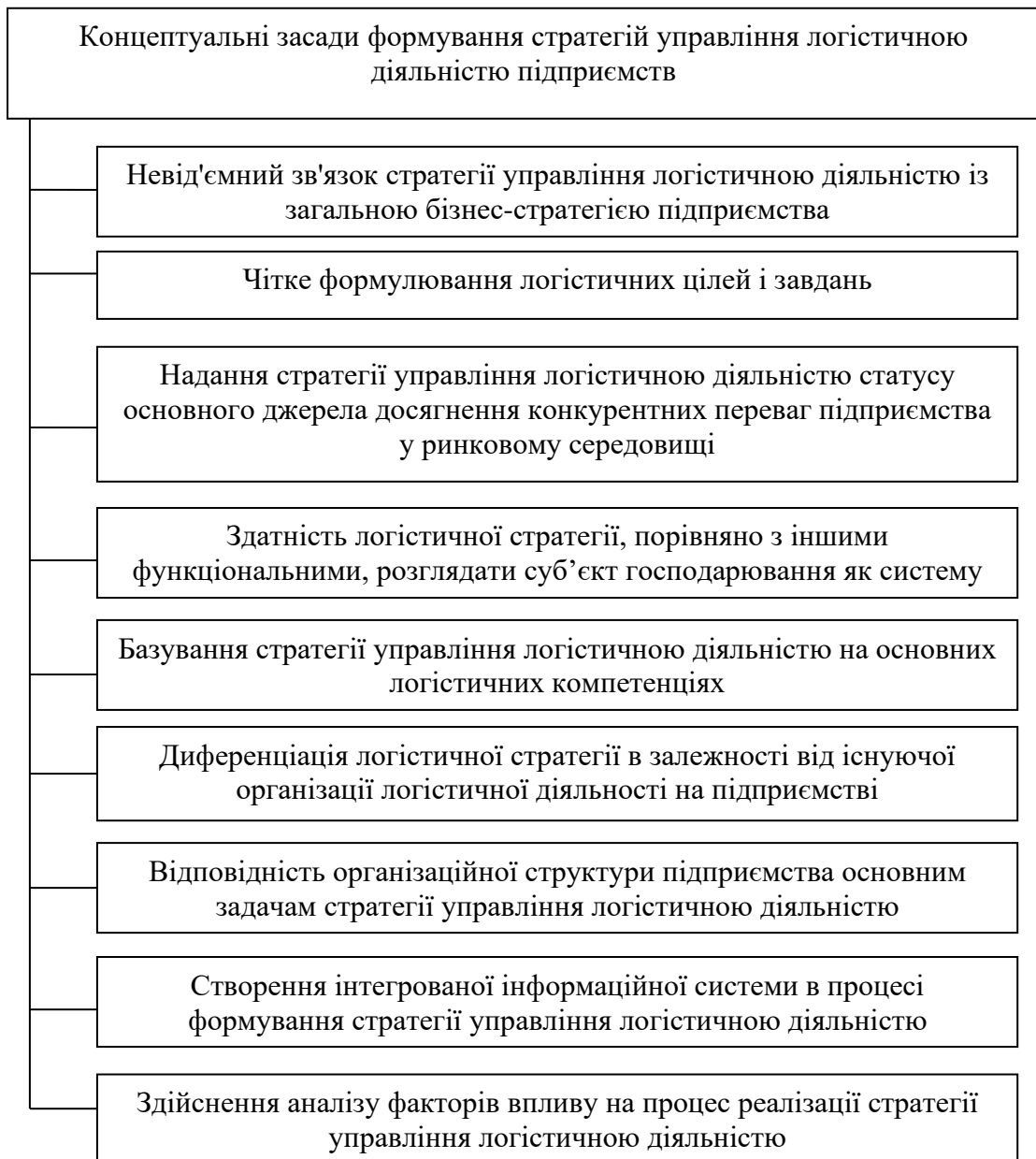
Рис. 1. Концептуальні засади формування стратегії управління логістичною діяльністю