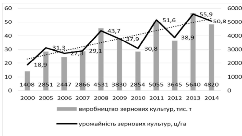
Рис. 2. Динаміка виробництва зернових культур у Полтавській області

На сьогодні, основну частку прибутків аграрні підприємства області отримують від галузі рослинництва, основою якої є виробництво зернових та зернобобових культур, цукрового буряка та ін. У 2014 році аграрними підприємствами Полтавської області вироблено 4820 тис. т зерна, що на 14,5 % менше, ніж у 2013 році. Така зміна зумовлена, як зниженням урожайності зернових культур (на 5,1 ц з 1 га, або на 9,1 %), так і зменшенням зібраної площі (на 60,6 тис. га, або на 6,0 %) [3]. Основними виробниками зернових культур є Гадяцький, Лохвицький, Миргородський райони. Середня урожайність зернових на Полтавщині у 2014 р. становила 50,8 ц / га (рис. 2).