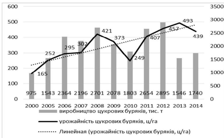
Рис. 3. Динаміка виробництва цукрових буряків у Полтавській області

Тваринництво Полтавської області сформувалося під впливом сприятливих природних та економічних умов для розвитку кормової бази, потреб населення в продукції тваринництва, територіального поділу праці та посилення міжрайонної функції області у виробництві тваринницької продукції. Основними галузями тваринництва Полтавської області є скотарство, свинарство, птахівництво (рис. 4).