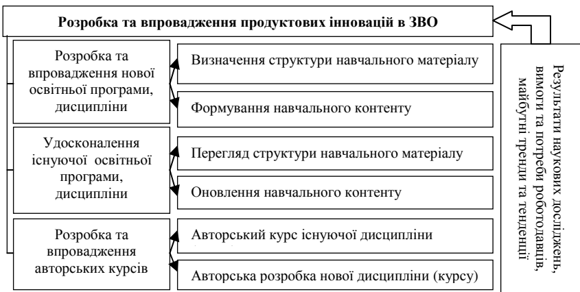
Рис. 2. Варіанти продуктивних інновацій в ЗВО

Результатом стратегії випереджального розвитку вищої освіти є розробка та впровадження в освітній процес закладу вищої освіти продуктивних інновацій (рис. 2).